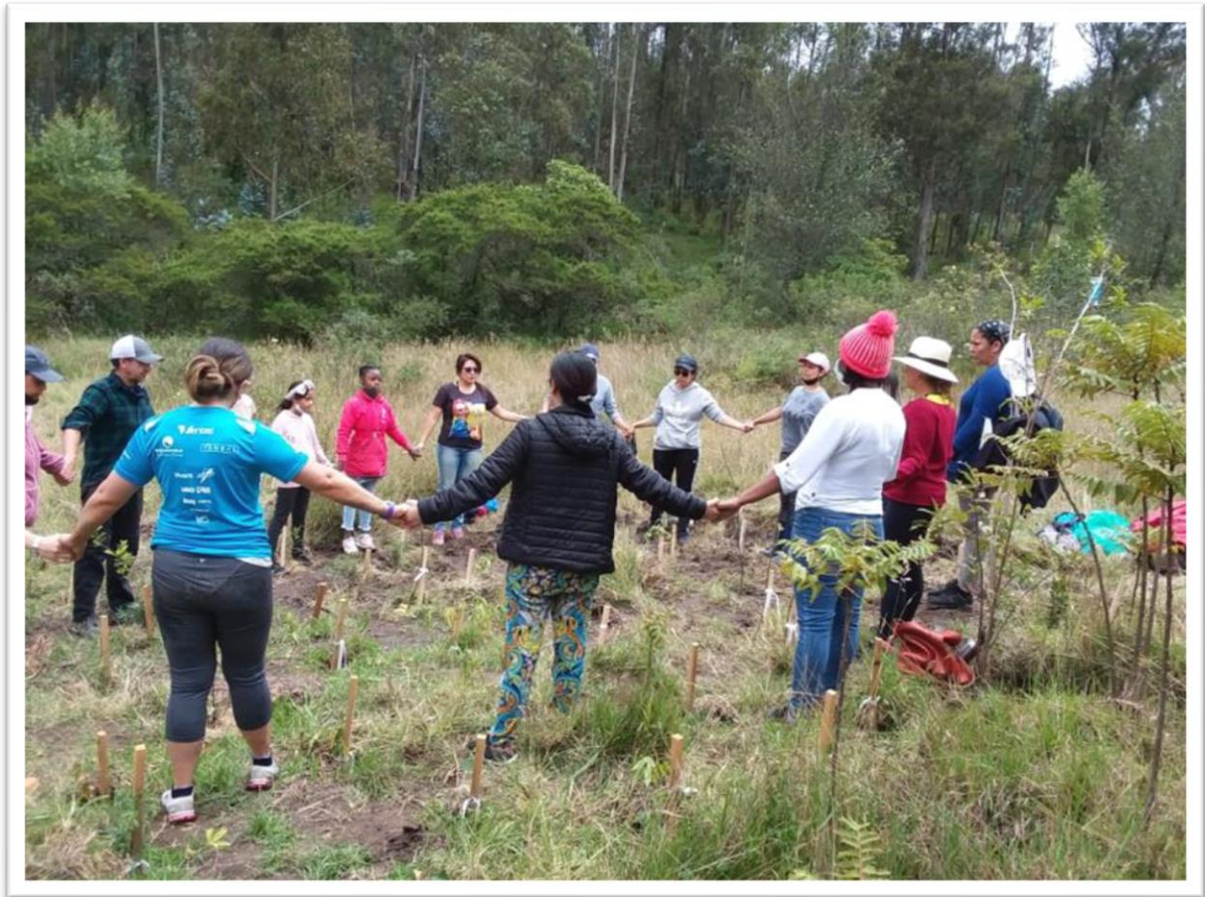
Círculo de Mujeres – Consulado en Quito 2021

Cabe señalar que, en todo caso, se logró el cumplimiento de la mayoría de las metas y productos del Proyecto de Inversión, gracias a la gestión de los Consulados, las Secciones Consulares y el Grupo Interno de Trabajo de Asistencia a Connacionales en el exterior.