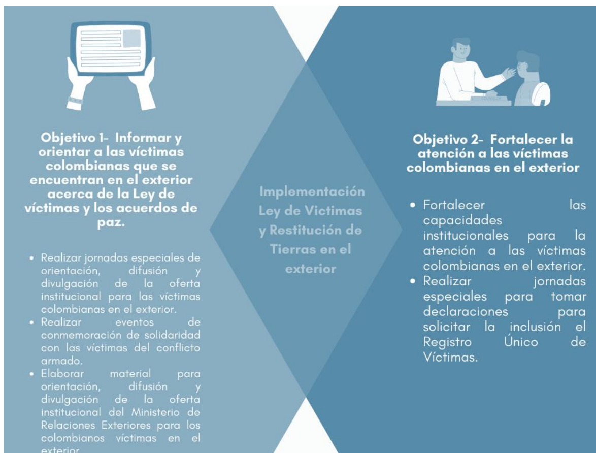
Gráfica 1: Objetivos y actividades del Proyecto de Inversión

El proyecto está estructurado a partir de dos componentes de acuerdo con dos objetivos y cinco actividades: