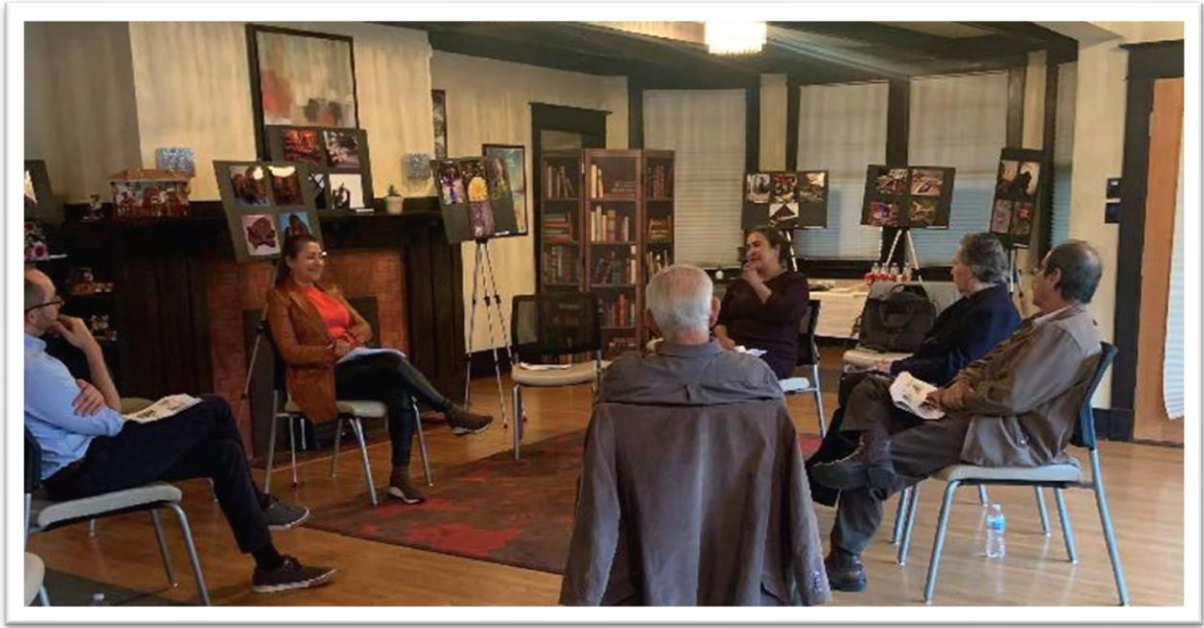
Taller de Salud Mental – Calgary 2021